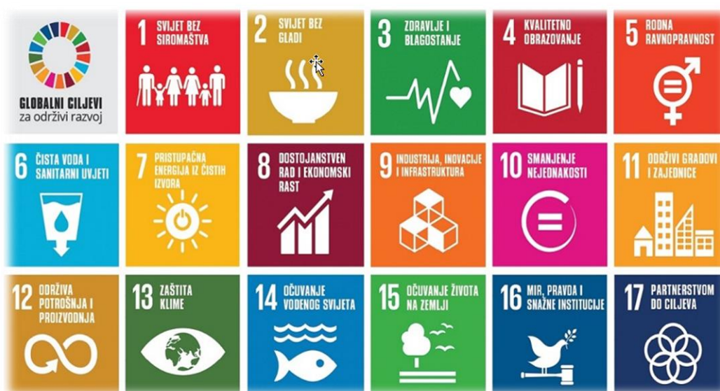
Slika 3. Slika Ciljevi održivog razvoja